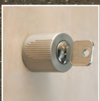
Drehzylinder matt vernickelt