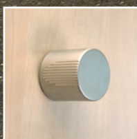
Griffknopf matt vernickelt