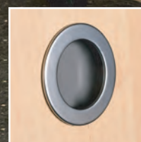
Muschelgriff rund matt verchromt