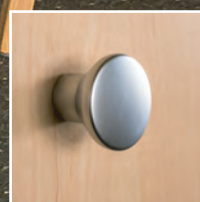
Möbeknopf matt verchromt