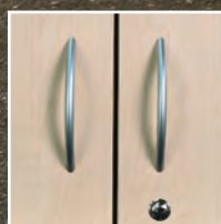
Bügelgriff matt verchromt